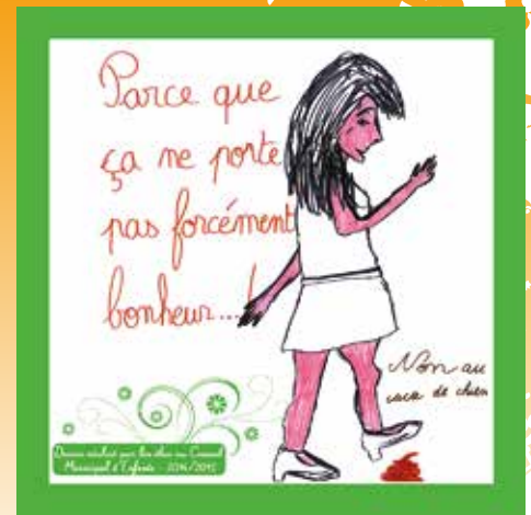
▲ Campagne de sensibilisation aux incivilités réalisée par les enfants du CME mandat 2014/2015.

Concernant les bruits de voisinage que bon nombre