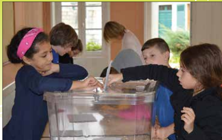
▲ Les élèves de l'école du Malcourlet ont pris leur rôle d'assesseur très au sérieux lors des élections des jeunes conseillers, le 26 septembre dernier.