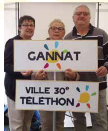
▲ Des membres de la délégation de Gannat au lancement du Téléthon national le 17 septembre dernier.

Le programme complet du Téléthon sera disponible courant novembre sur le site ville-gannat.fr