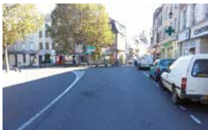
◀ Ci-contre, l'entrée nord de la Grande rue, en 2016.