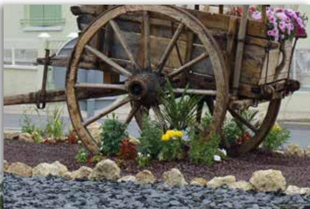
▲ Le rond-point, avenue des Capucins, accueille depuis peu une charrette posée sur de la pouzzolane, une pierre volcanique utilisée ici comme couvre-sol.

er la nature en ville ! La végétation spontanée est