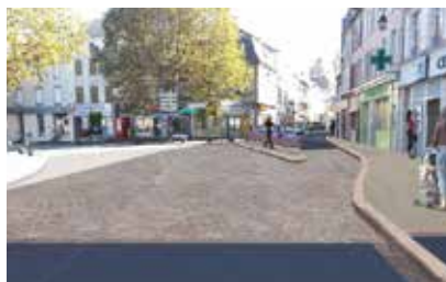
◀ Ci-contre, projection de l'entrée nord de la Grande rue après les travaux de réaménagement prévus en 2017.