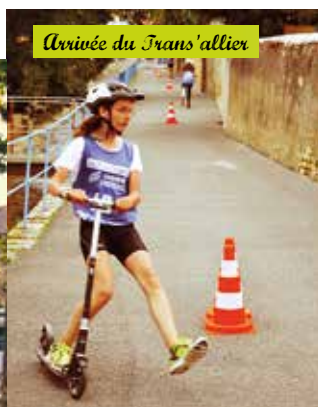
Arrivée du Trans'allier