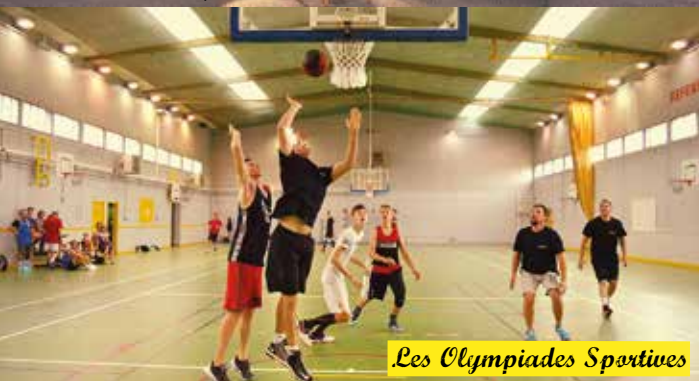
Les Olympiades Sportives