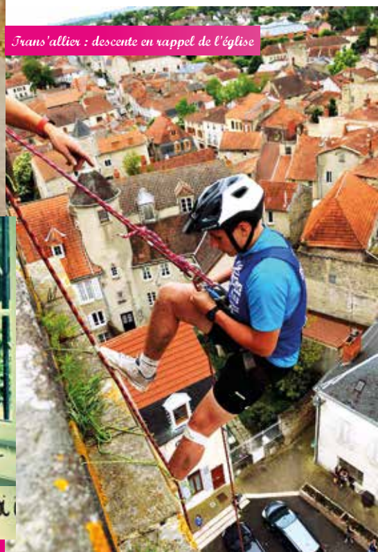
Trans'allier : descente en rappel de l'église