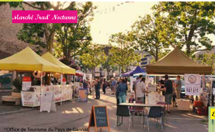
Marché Trad' Nocturne